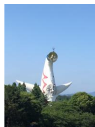
我々を見守る太陽の塔

最後に、全く関係ありませんが、3週間に1回は大阪に帰っているため、何かと目にするのある太陽の塔を御覧ください(写真左 2018年6月9日撮影)。実物を見るのにおすすめなのは日没で、怪しげに目が光ります(これについては実際に見てください)。ライブカメラで見ることできます(「ライブカメラ 万博記念公園」で検索。ただし今の所、画像はパラパラ)。論文執筆や書類仕事などで疲れた時におすすめです。癒やされることはありません。