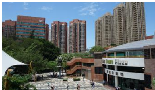
写真:危機対応学HPより

http://web.iss.u-tokyo.ac.jp/crisis/research/1806meridian180.html